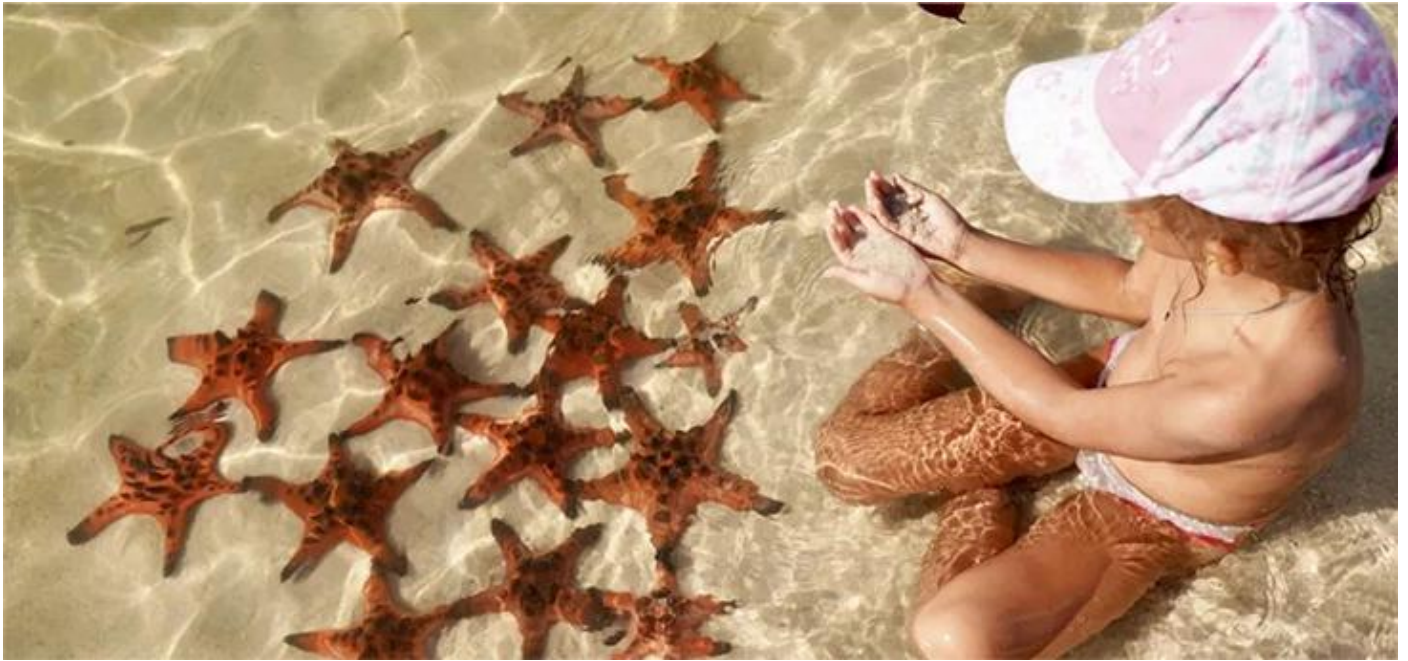
PHOTO BY TONY WONG © 2014. PHOTO BY JESSIE LEE ALL RIGHTS RESERVED. NO PART OF THIS PUBLICATION MAY BE REPRODUCED OR TRANSMITTED IN ANY FORM OR BY ANY MEANS.

沙滩得名来自于经常活跃在这里的红海星，点点的海星安静地卧于白沙滩，形成一道特别的风景线。温馨提醒：海星看完后一定要放到水中，而且不能翻过来，不然他们会死掉的！一起爱护这群可爱的，且跟我们生活在同一星球的海星宝宝吧！